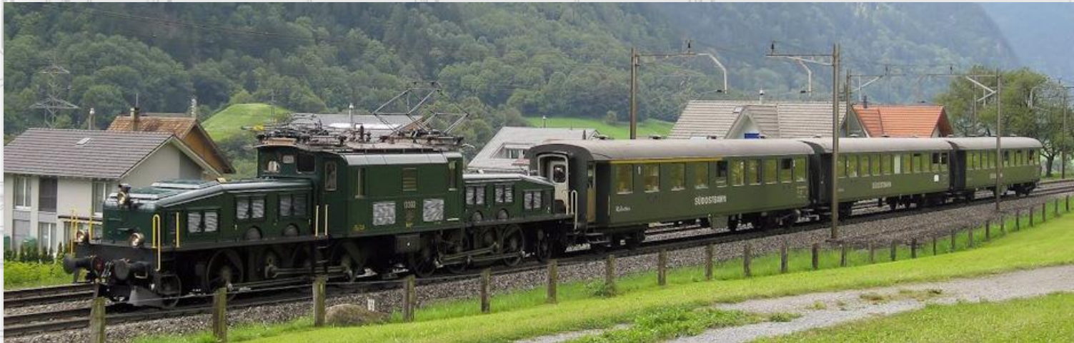
Kurz vor der Stilllegung der Wagen, wegen fehlender Revision.